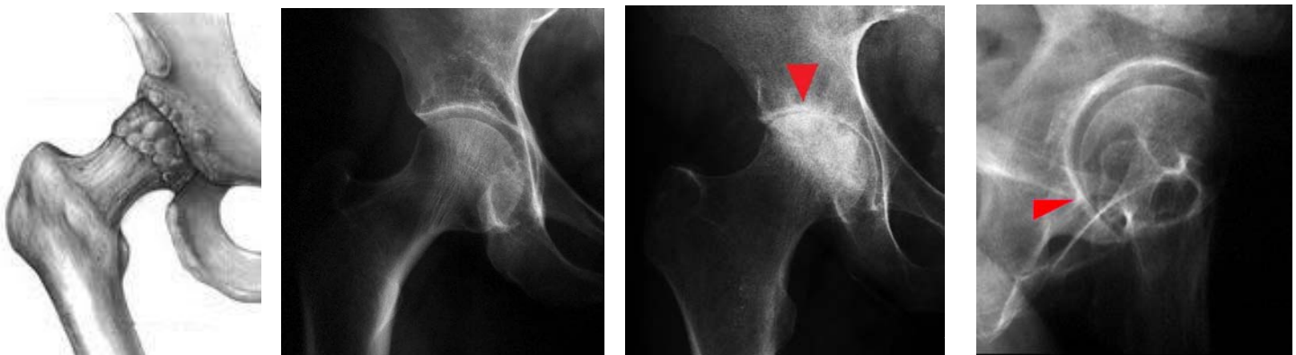
Face : Radio normale

Radiographie du bassin de face en charge et le faux- profil de Lequesne. Cette incidence est indispensable. En effet, parfois, l'arthrose postérieure n'est mise en évidence que sur le profil. Les principaux signes sont le pincement de l'interligne articulaire, l'ostéophytose marginale, l'ostéosclérose condensante de l'os sous-chondral et les géodes (30 à 40% des cas).